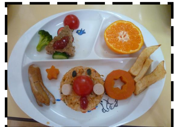
アンパンマンランチ

生まれて初めて口にするおかゆや、スープを飲んで不思議そうな顔をしたり、好きな食べ物、嫌いな食べ物がはっきりしたりと、それぞれ様々な食に対する好みが見えてきました。毎日おいしいごはんをたくさん食べますが、見た目も可愛いアンパンマンランチを見た子どもはとてもニコニコと目の前のカラフルな食材を、嬉しそうに眺めていました！これからも、いろいろな料理に目で触れて、ご飯を楽しく食べようね♪