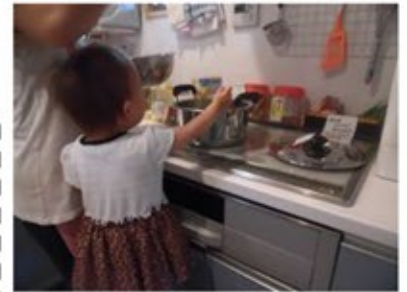
はじめてのラーメン作り!