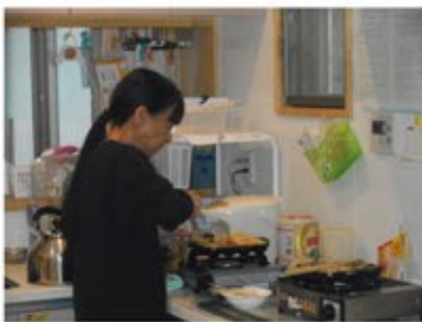
おやつ作りをする職員