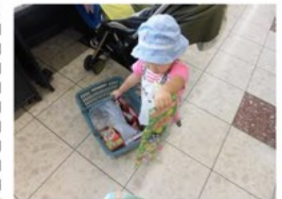
スーパーへお買いもの

近所のスーパーへみんなで買い出しに行ったり、材料に触れる機会も増えました。一からカレーを作ったり、フライドポテトを揚げたりして、料理の時間も楽しみました。