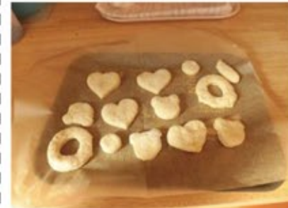
こども達が型抜きしたドーナツ生地