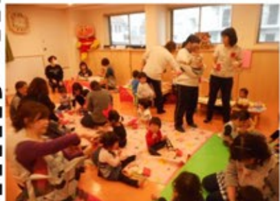
全員集まって、おやつパーティ☆

クリスマス会では子ども達と保護者の方々と食事をしました。クリスマスケーキをいっしょに食べて、子どもたちはとてもうれしそうでした。3月の春のつどいでも、親子共食で乳児院のカレーを子どもたちと食べます。おいしく食べて、あたたかな春を迎えましょう。