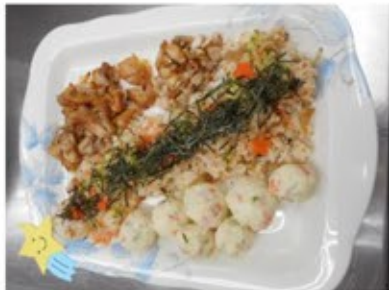
七夕のごちそう。から揚げいっぱい。