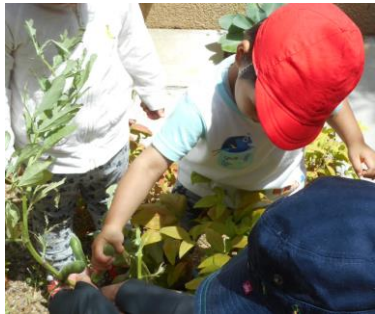
みんなで育てたそら豆を収穫

冷え込みにふるえる日もありますが、子ども達は寒さなんてなんのその。毎日お外でたくさん遊んで、おなかをペコペコに減らし帰ってきます。モリモリと食事食べる子ども達の姿に「しっかり食べられるようになったなあ」「ちゃんと野菜も食べてる!」「スプーンを持って食べられるんだ…!」などと、子ども達それぞれの成長が感じられ、感慨は尽きません。今年も子ども達と、たくさんの楽しくおいしい時間を過ごすことができました。今月は2019年度に取り組んだ、食事の取り組みをご紹介します。