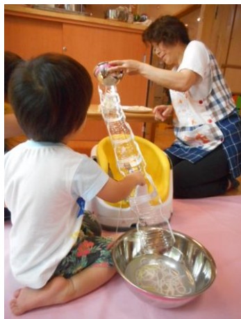
職員手製の流しそうめん器で流しそうめんを楽しみました!