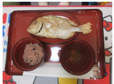
お百日のお食い初め膳