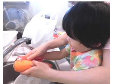
にんじんを、むきむき