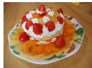
クリスマスは各ホームでケーキを作りました