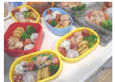
お手製のお弁当を持って、遠足に♪