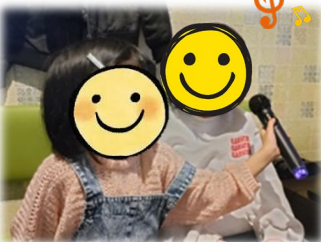
仲良く楽しく歌いました♪

2月15日に風と虹フロア合同の取り組みでカラオケに行きました。片道30分歩いてお店に到着した頃にはみんな喉がカラカラ。まずはドリンクバーで最初の一杯を飲み干して早速カラオケスタートです。最初は遠慮がちな子ども達も気づけば次から次へと曲を選んでノリノリで歌っていました。「○○ちゃんはこの曲好きなんじゃない？」「みんなで歌える曲にしよう！」