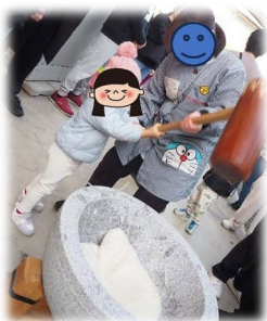
よいしょ〜！よいしょ〜！べったん

寒い日でしたが、たくさんの方にも参加していただき、子どもたちと一緒に餅をついたり、子どもたちは園庭を走り回ったり、寒さも吹き飛ばす盛り上がりでした。杵と臼を使った本格的な餅つきに、はじめは緊張した表情の子どもたちでしたが、大人と一緒に「よいしょよいしょ！よいしょ！」と力を合わせて餅つきを楽しみました。