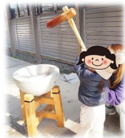
慣れてきたらひとりでもできたよ