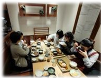
好きな定食を選んで食べました

など、とても和やかな雰囲気の中で楽しい時間を過ごすことができました。最後は「世界に一つだけの花」を全員で熱唱してカラオケ終了です。歌い続けてお腹ペコになったところでお昼ご飯を食べました。みんな静かに黙々と食べている姿が微笑ましかったです。たくさん歩いて歌って、食べて、とっても充実した休日になりました。