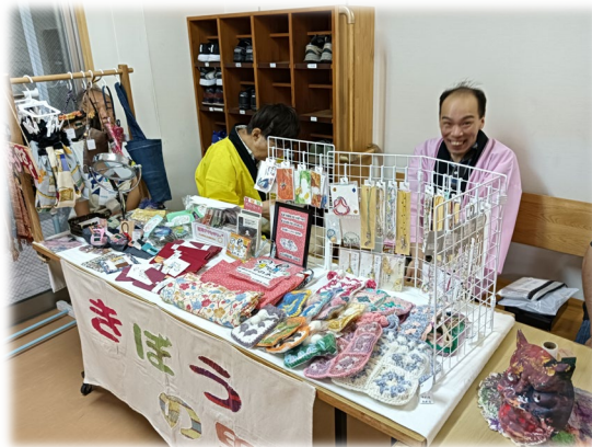
自主製品の売上が利用者の給料になります

あさひ希望の里は、大阪市旭区におい て、障がいのある方々が地域の中で自分 らしく安心して暮らし、働くことを大切 にしています。日中活動や生活支援を通 じて、一人ひとりの思いや可能性に寄り 添い、「ともに生きる」社会の実現をめ ざしています。 さて、私たちは、障がいのある人の「働 く」「暮らし」を応援する全国組織 「きょうされん」に加盟しています。そ れは、制度の充実や社会的理解の向上を 求める運動を、全国の仲間と力を合わせ て進めていきたいという思いからです。 現場での実践を土台に、声を社会へ届け ていくことも、私たちの大切な役割であ ると考えています。