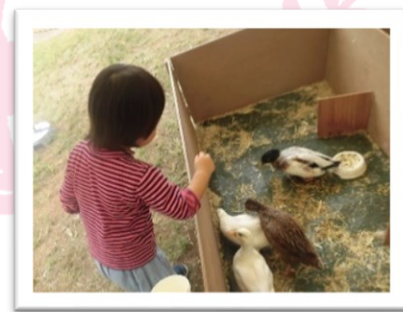
ドキドキしながらえさやり体験