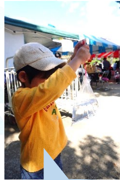
見て、メダカつかまえた～

クリスマスの装飾を見るとどうぶつ王国にいたトナカイを思い出し「トナカイおったな」と本物を見た感動を今でも話してくれています。生き物との触れ合いは子どもたちの優しい気持ちも育てているように感じます。 おおいろグループ 阪田