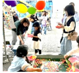
スマートボールすくい出店