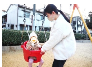
公園のブランコに乗ってご機嫌♪