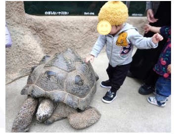
どうぶつ王国で大きなリクガメにタッチ！