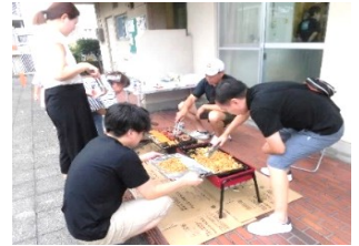
OBのみなさんと食べて飲んで